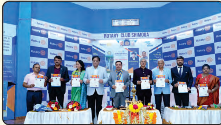
ರೋಟರಿ ಕ್ಲಬ್ ಶಿವಮೊಗ್ಗದ ವಿಶ್ವಮಿತ್ರ ಬುಲೆಟಿನ್ ಬಿಡುಗಡೆ