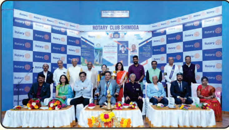
ರೋಟರಿ ಕ್ಲಬ್ ಶಿವಮೊಗ್ಗ 2025-26 ರ ನೂತನ ಪದಾಧಿಕಾರಿಗಳು