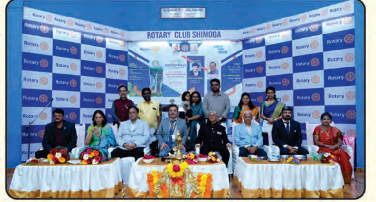
ನೂತನ ಸದಸ್ಯರುಗಳ ಸೇರ್ಪಡೆ